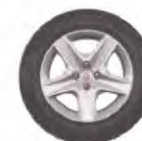
Rodas Flex Wheel Oasis 16"