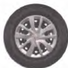
Calotas Magicco 15"